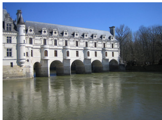
Chenonceau (le « Pont de Diane »)