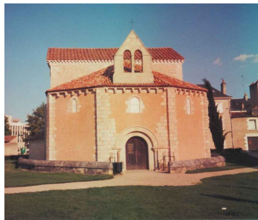
Baptistère (Poitiers, VI e s.)