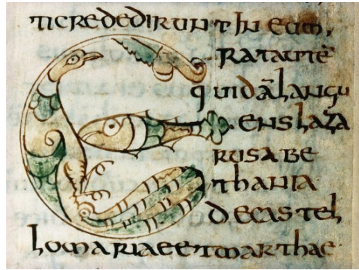
Lettre zoomorphique (Ms d' Autun, v. 755)