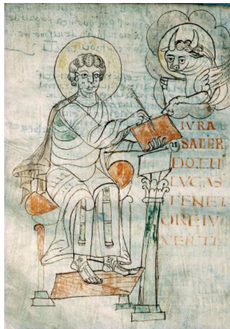
saint Luc (manuscrit d' Autun, v. 755)