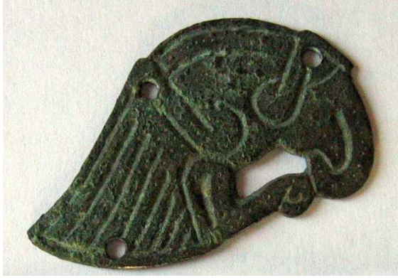
Applique en forme de rapace bronze (VI e s.)